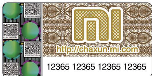
Наклейка со стертым защитным слоем